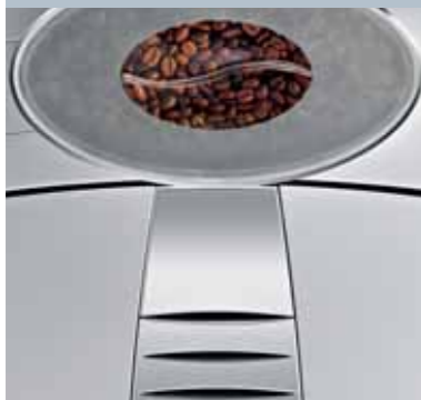
Klares Design in edlem Finish