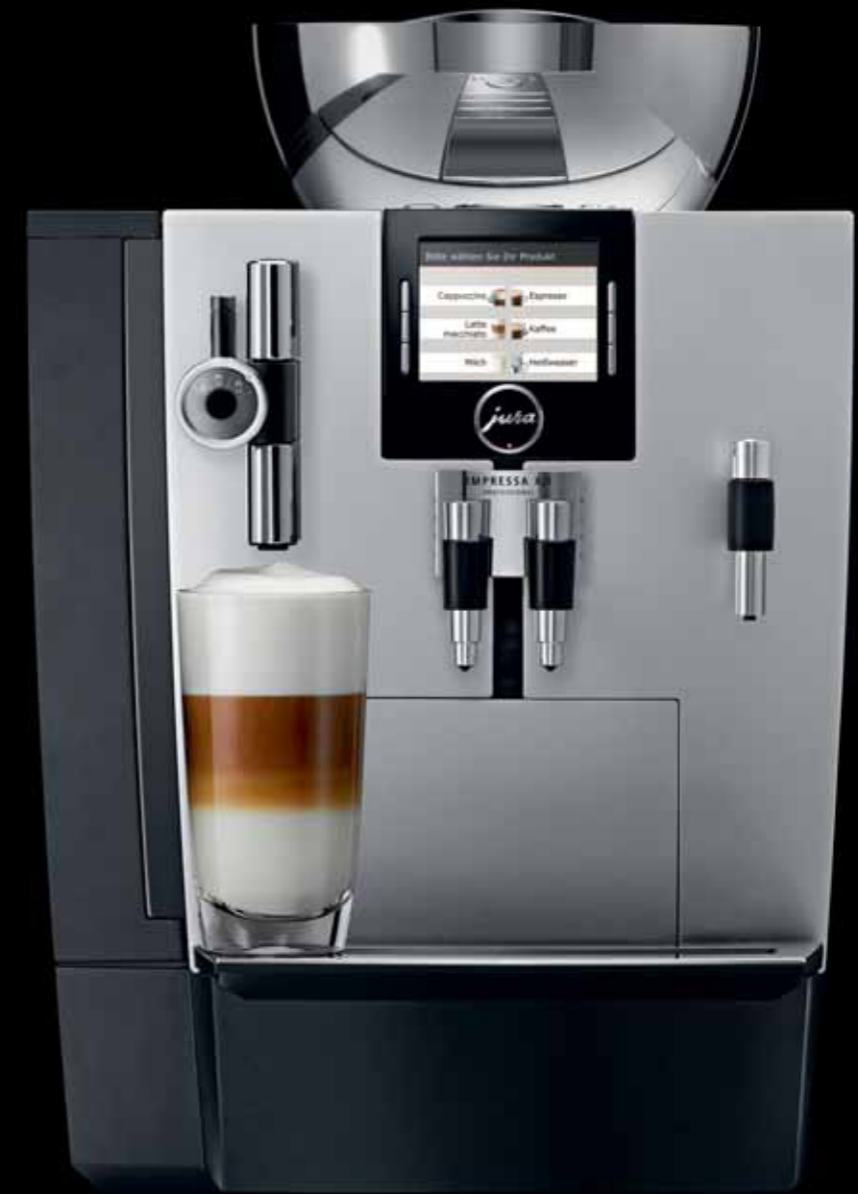
IMPRESSA XJ9 Professional

Registrierte IMPRESSA XJ-Kunden kommen in den Genuss eines exklusiven, neuen Servicekonzepts, das dem hohen Qualitätsstandard von JURA vortrefflich gerecht wird. Diese Dienstleistung stellt die Leistungsfähigkeit der professionellen Vollautomaten sicher und dient deren Werterhalt, 25 Monate oder 20.000 Bezüge lang. Dies beinhaltet z. B. zwei Inspektionen nach 9 und 18 Monaten beim Servicepartner.