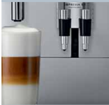
One Touch Cappuccino/ Latte macchiato